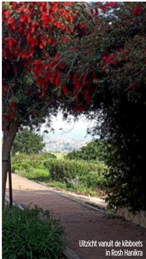
Uitzicht vanuit de kibboets in Rosh Hanikra

"Wie steeds op de wind let, zal niet zaaien; en wie steeds naar de wolken ziet, zal niet maaien."